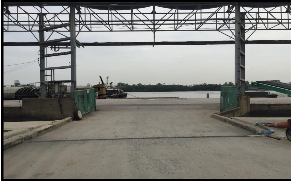
Front port view