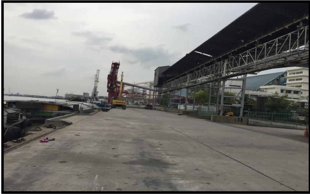
Port right view