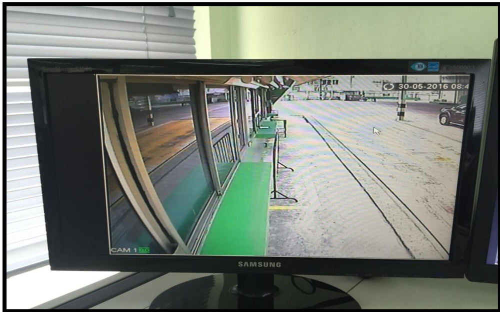
Front road in port